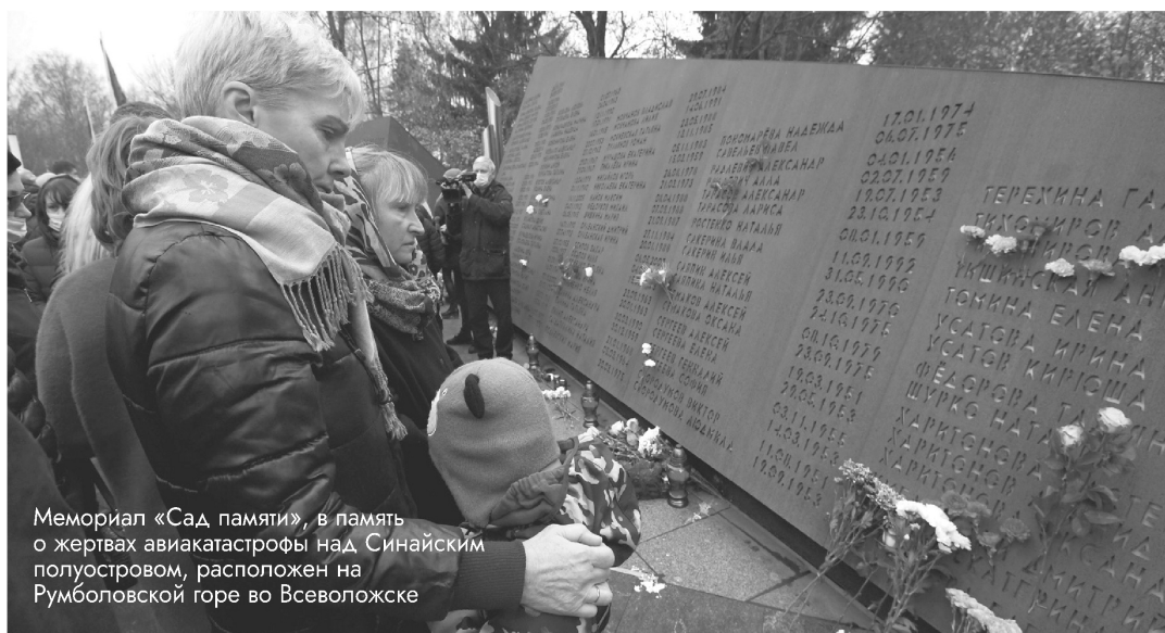
Мемориал «Сад памяти», в память о жертвах авиакатастрофы над Синайским полуостровом, расположен на Румболовской горе во Всеволожске

Этот день напоминает нам о важности сплочённости, солидарности, единства в борьбе с угрозой. Важно не бояться говорить об этих страшных событиях. Важно не допускать классовую или межконфессиональную вражду, призывать каждого к бдительности и ответственности. Быть внимательнее друг к другу, чтобы вовремя распознать любые виды воздействия идеологии терроризма, жертвой которого может стать любой из нас или наших близких