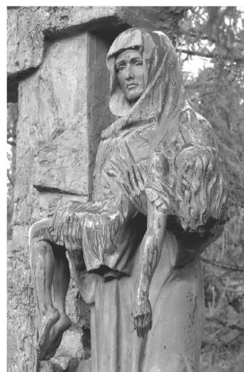
Памятник «Детям Беслана» в Малоохтинском парке

– Каждый год мы вместе с петербуржцами и жителями области возлагаем цветы у подножия памятника Детям Беслана в храме Успения Пресвятой Богородицы на Малоохтинском проспекте. Там же служим литургию. В этом году также приглашаем присоеди-